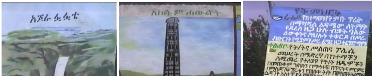
1 & 2 PAINTINGS INSIDE AND OUTSIDE SCHOOLS 3. INFORMATION ON DISTANCE LEARNING