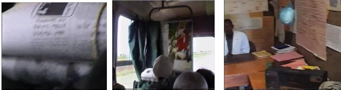
ADDIS ZEMEN - NATIONAL NEWSPAPER DELIVERY TO WELAYTA DISTRICT IN ETHIOPIA - 2003