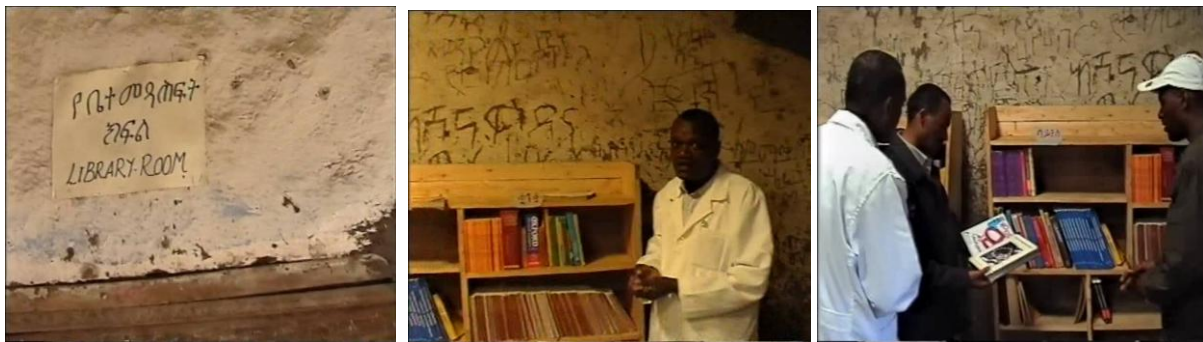
HEADTEACHERS SHOWING SOME OF DONATED BOOKS IN THEIR PRIMARY SCHOOLS LIBRARIES - 2003