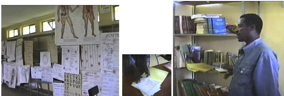
HEADTEACHERS (SECONDARY SCHOOLS) SHOWING SOME OF RESOURCES DEVELOPED BY TEACHERS AND STUDENTS AND THEIR SCHOOL LIBRARY – 2003