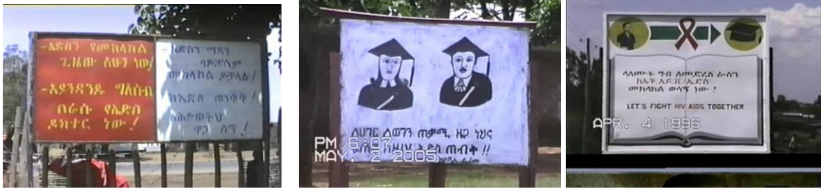
HIV/AIDS BANNERS ON ROAD SIDES AND INSIDE SCHOOLS COMPOUNDS - 2003